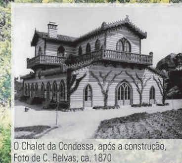
O Chalet da Condessa, após a construção

Criador do Parque e Palácio da Pena, D. Fernando II (1819-85) casou em segundas núpcias (1869) com Elise Hensler, Condessa d'Edla (1836-1929). Construíram ambos o Chalet da Condessa e o Jardim envolvente na zona ocidental do Parque da Pena entre 1864-69